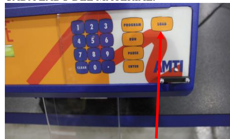
8. OPRIMIR LA TECLA DE "LOAD" Y MOVER EL PROTECTOR PLÁSTICO DE SEGURIDAD DEL TECLADO HACIA LA DERECHA.