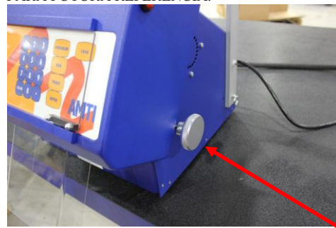
6. AJUSTAR EL RODILLO GUÍA INFERIOR APROXIMADAMENTE UN 1/4" DE PULGADA A CADA LADO DEL MATERIAL.