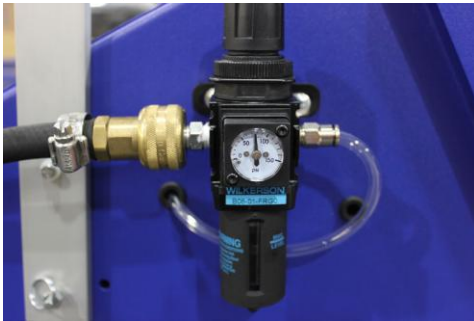
1. CONECTAR LA LÍNEA DE AIRE Y AJUSTARLA A 80 PSI.

*PRECAUCIÓN: SIEMPRE APAGAR EL SUMINISTRO DE ENERGÍA ELÉCTRICA Y DESCONECTAR LAS LÍNEAS DE AIRE ANTES DE INVESTIGAR SI HAY ALGO ESTANCADO O CUALQUIER ASUNTO DE FUNCIONAMIENTO INTERNO. NUNCA PONGA SUS DEDOS, MANOS O HERRAMIENTAS ADENTRO DE LA MAQUINA MIENTRAS ESTE ENCHUFADA O TENGA EL AIRE CONECTADO.