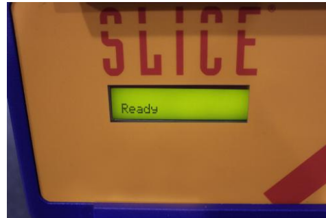
2. PRENDER EL INTERRUPTOR LOCALIZADO EN LA PARTE DE ATRÁS DE LA MÁQUINA.