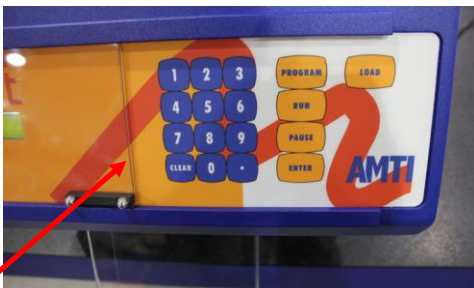
7. DESLIZAR A LA IZQUIERDA EL PROTECTOR PLÁSTICO DE SEGURIDAD DEL TECLADO.