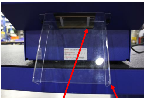
5. GUÍA INFERIOR PROTECTOR DE SEGURIDAD INFERIOR